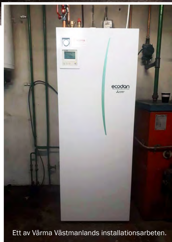
Ett av Värma Västmanlands installationsarbeten.