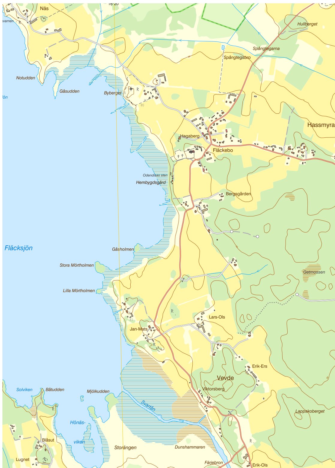
Skala 1:10 000, SWEREF 99 TM, RH 2000. Källa, Lantmäteriet http://www.lantmateriet.se/kartuskrift