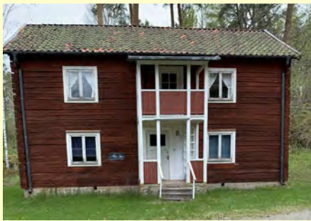
Brunnsmuseet, Urban Hjärnes väg 5, 733 95 Sala • www.brunnsmuseet.se