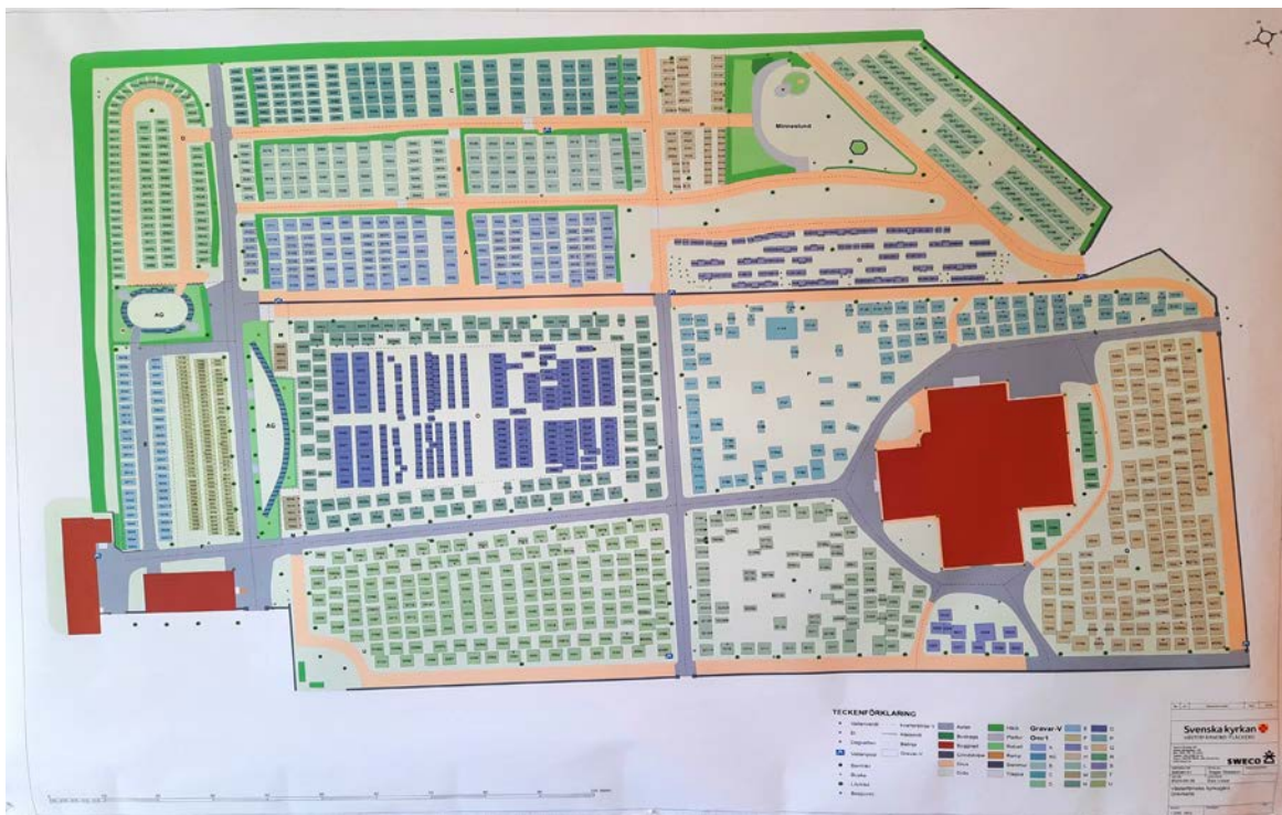
Karta över Västerfärnebo kyrkogård, indelad i kvarter.